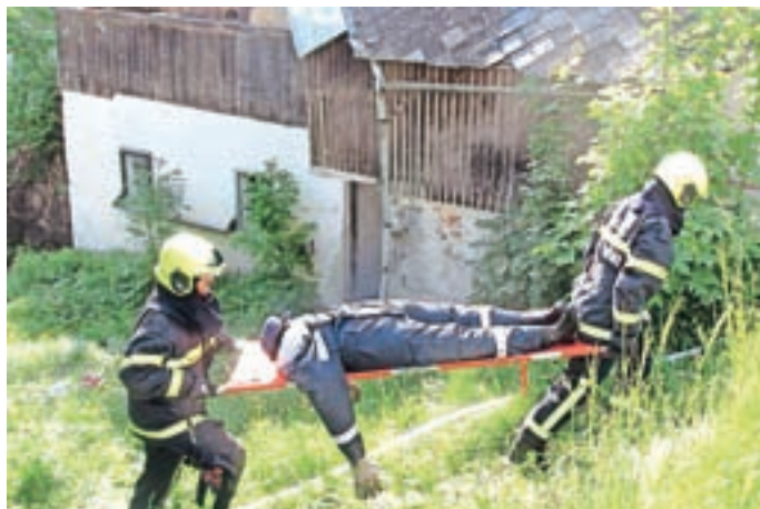
Maja smo organizirali društveno operativno vajo.