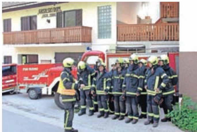
Del operativne enote, ki je sodeloval na društveni vaji.

Na nivoju gasilskega poveljstva občine Železniki se letno organizirajo tudi občinske vaje. Za uigranost operativne enote