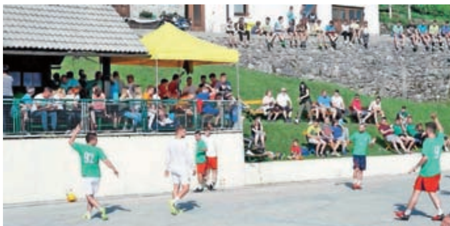
Turnir je privabil lepo število gledalcev.