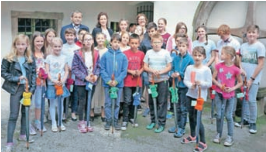
Del učencev, ki so bili nagrajeni na literarnem, likovnem in fotografskem natečaju.