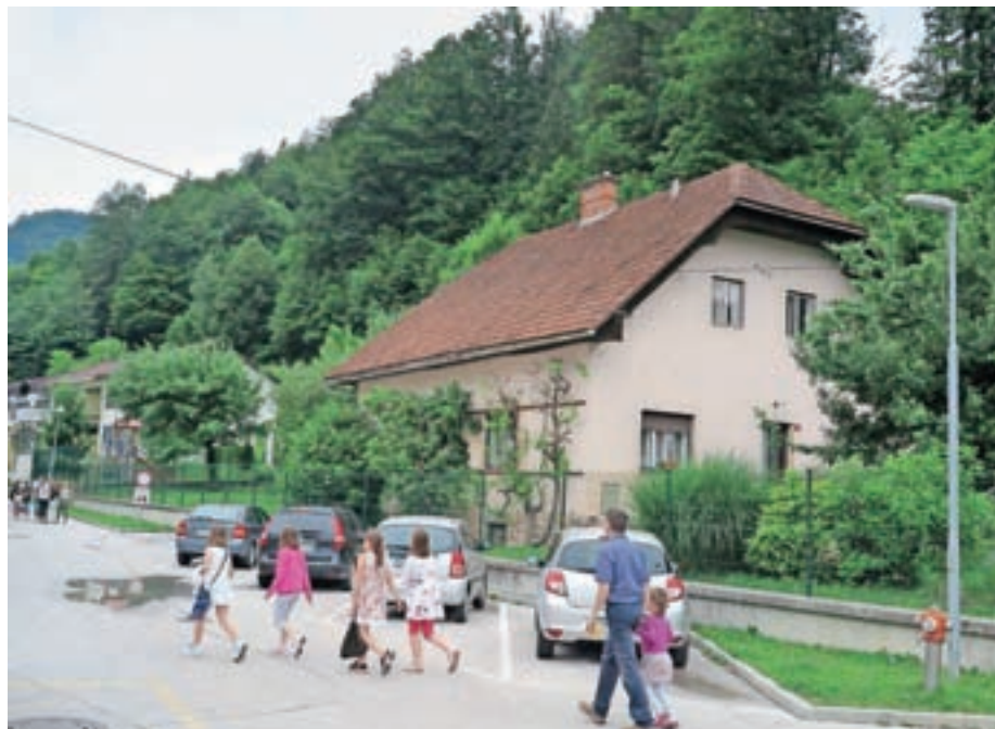
Hiša za OŠ Železniki, ki jo občina namerava odkupiti za potrebe širitve Vrtca Železniki.

Svetniki so se seznanili tudi s poročilom Toplarne za leto 2017. Lani so prodali 10.368 Mwh toplotne energije, od tega