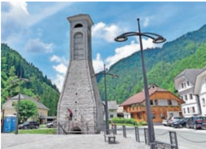
Plavž po obnovi zunanosti kaže lepšo podobo.

"O rekonstrukciji lokalne ceste Podlonk–Prtovč lahko povem, da je asfaltiranje zgornjega dela ceste predvideno do 20. junija, zatem pa bo sledila še rekonstrukcija križišča. Trajala naj bi do sredine julija, potem pa se bo izvajalec lotil rekonstrukcije do-