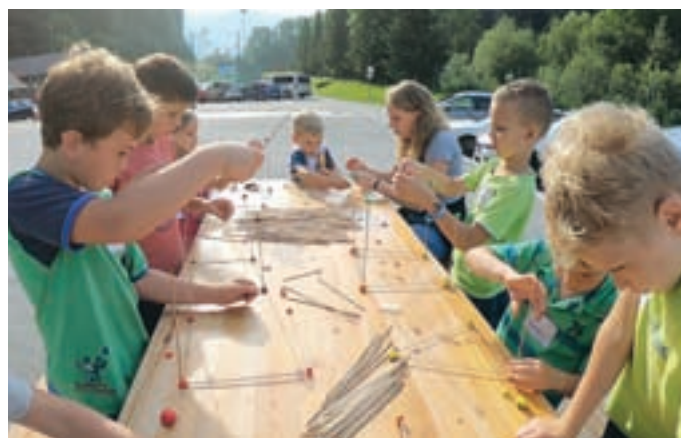
Mladi arhitekti – kaj vse se da sestaviti iz preprostih paličic ...