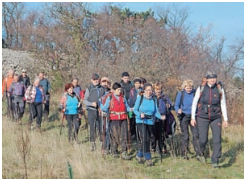
S planinske ture v neznano