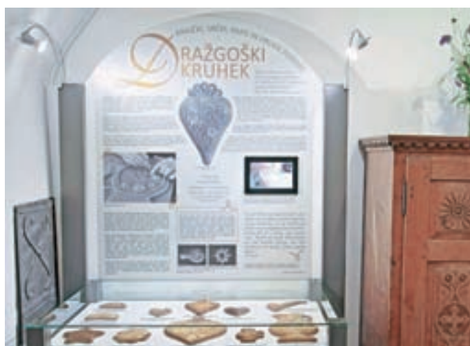
Muzejski kotiček o dražgoškem kruhku

Od maja 2018 dalje so v Muzeju Železniki stalno na ogled "ta mali" kruhki ali dražgoški kruhki – ročno oblikovano in krašeno pecivo iz medenega testa, značilno predvsem za Dražgoše in Železnike. V muzejskem kotičku so predstavljene danes pogoste oblike: srce, krajček, majolika, fajfa, deteljica in zvezda. Znane oblike so še: roža, zajec, riba, konj, jelen, podkev, monštranca, pleten panj, cigara, putka, škarje, ura in razni novoletni okraski. V zadnjem času oblike na željo naročnikov pogosto segajo izven nabora tradicionalnih oblik. Izdelovanje, podarjanje in prejemanje kruhkov je (bilo) vezano na osebne in verske praznike. Izdelani so iz moke, medu, jelenove soli in začimb (mletih klinčkov, cimeta in popra). Recepti za dražgoške kruhke se nekoliko razlikujejo – odvisno