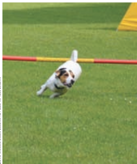
Športno kinološko društvo Železniki, Na Plazu 49, 4228 Železniki

ditev. Med drugim smo ponovno obudili agility, izdelali nove ovire in kmalu že organizirali prvo tekmo. Zaradi nove lokacije in območja delovanja se je leta 2004 društvo preimenovalo v Kinološko društvo Škofja Loka - Železniki. Istega leta smo imeli veliko srečo, da je KS Selca urejala vodovod in Elektro Gorenjska polagal visokonapetostni kabel, trasa pa je potekala po cesti za brunarico – tako smo prišli do vode in električnega priključka. Z vsako tovrstno pridobitvijo smo si izboljšali pogoje za delo, tečaji lahko potekajo v večernih urah, izgradili pa smo tudi prepotrebne sanitarije. V letu 2007 je bil odkupljen del zemljišča, ki ga danes uporabljamo, in tako je društvo prvič v zgodovini svojega obstoja pridobilo lastninsko pravico nad vadiščem in objekti na njem. Na žalost pa je ves vložen trud že jeseni tega leta uničila vodna ujma, ki je povzročila ogromno škode na objektu in vadišču. Potrebne ga je bilo veliko truda in prostovoljnega dela članov društva, da smo zopet vzpostavili stanje, kakršno je bilo pred poplavami. Pri tem nam je z zbiranjem solidarne pomoči pomagala KZS, predvsem komisija za agility, ki je organizirala tekmo z namenom, da se zberejo sredstva za prepotrebno pomoč. KZS pa nam je za leti 2008 in 2009 odpustila plačilo članarine. Nekaj finančne pomoči smo prejeli tudi od Občine Železniki, zelo veliko pomoč pa smo dobili od enote vojakov inženirske čete, ki je brunarico, ki jo je voda prestavila s temeljev, s pomočjo dviga-