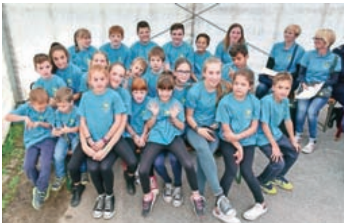
Jubilejno slovesnost so popestrili otroci, mnogi so tudi gasilci.

Gre za društvo prve kategorije, ki pokriva tudi precej zahteven, hribovit teren v okolici. "Zadnji večji projekt je bil nakup gasilske-