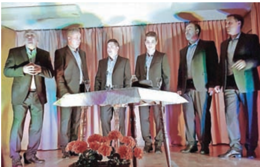
Večer so popestrili pevci skupine Vocal Bača iz Podbrda.