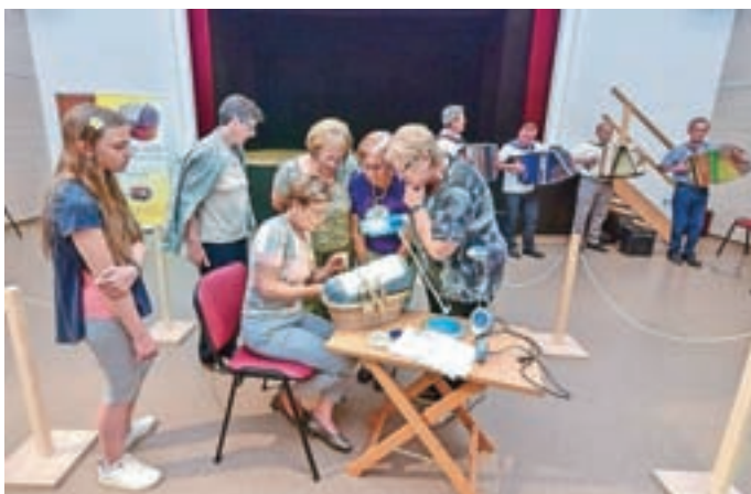
Za istim punkljem se je zvrstilo 55 klekljaric in en klekljar.