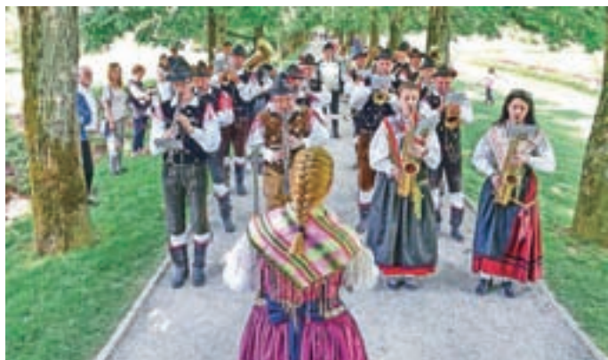
Pihalni orkester Alples Železniki

V letošnjem evropskem letu kulturne dediščine smo tako tudi v Turističnem društvu Železniki pozornost namenili predvsem dediščini, ki je močno vplivala na naše bivanjsko okolje in življenje naših prednikov.