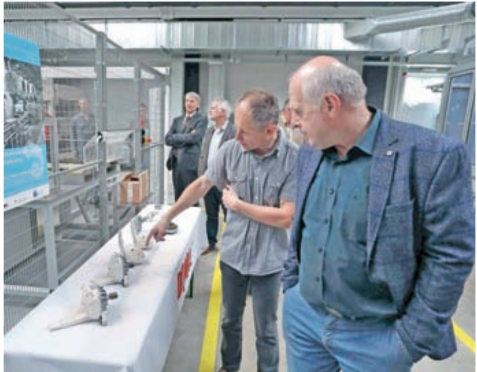
Na Trati izdelujejo tudi nov motor za Gorenjev pralni stroj.

Skupina Domel ima na petih lokacijah že 1370 zaposlenih, od tega 1292 v Sloveniji, preostale pa na Kitajskem. Leto 2017 je bilo že četrto leto zapored v znamenju velike rasti. Prihodki od prodaje so lani zrasli za 14 odstotkov: v Sloveniji so znašali 134,4 milijona in na Kitajskem 8,1 milijona evrov. Ustvarili so 9,8 milijona evrov čistega dobička, kar je največ doslej. Letos se po besedah Čemažarja nadaljuje trend lanske rasti, ki jo utegnejo do konca leta celo preseči. Rast je bila lani predvsem na novih programih: na elektronsko komutiranih motorjih in komponentah, ki se izdelujemo na novi lokaciji na Trati. Prihodki od prodaje osnovnega programa sesalnih enot so lani zrasli