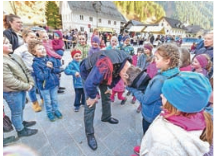
Otroška folklorna skupina iz Železnikov je prikazala igrice, ki so se jih igrali nekoč, med drugim rihtarja bit.