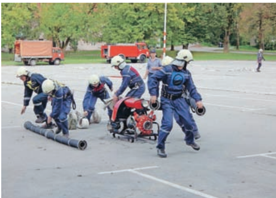
Člani PGD Zali Log se redno udeležujejo tekmovanj.