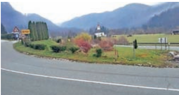
Primera neustrezne ureditve

Če lastniki zemljišč vegetacije ne bodo odstranili sami, bo to na njihove stroške naredil vzdrževalec občinskih cest, zoper lastnike pa bodo uvedeni ustrezni postopki.