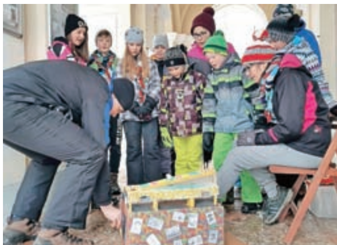
Velika igra Roberta Baden-Powella

so sledili sledem zmedenega profesorja, ki naj bi jih pripeljale do njegovega izuma. Razrešiti so morali različne uganke, da so se dokopali do zemljevida, ki vodi do izuma ter mu nato na orientaciji natančno slediti, da so prišli na cilj. Ob koncu tedna so imeli tudi krst in sprejem novincev v četo. Klan pa se je na zimovanje odpravil od 23. do 25. marca. Tabor so začeli s križevim potom s svečkami v Srednji vasi nad Bohinjem. Naslednji dan so nadaljevali pot na planino Krstenica. Pot je bila dolga in naporena, ker ni bila uhojena in je bilo še veliko snega, ampak je postregla s prekrasnimi razgledi. Domov so se vrnili z lepimi spomini in novimi izkušnjami.