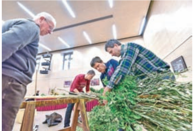
Izdelava skoraj desetmetrske butare velikanke