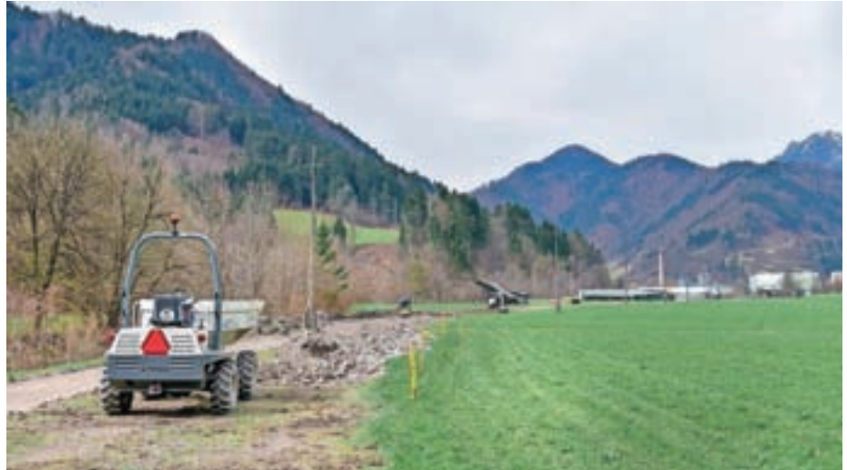
Gradnja tlačnega kanalizacijskega voda in črpališča na Studenem bo stala 99 tisoč evrov.

V prihodnjem tednu se bo začela gradnja infrastrukture v Dašnici, kjer bodo do konca junija zgradili 160 metrov pločnika ter obnovil fekalno in meteorno kanalizacijo in vodovod med hišnima številčkama Dašnica 45 in Dašnica 60. Vrednost del je slabih 230 tisoč evrov. Ureditev Racovnika, kjer bodo položili fini asfalt, je predvidena v poletnih mesecih. Še pred tem pa bodo maja sanirali fasado plavža. "V celoti ga bomo očistili, obnovili vse fuge in tudi očistili kovinske dele. Sanacija bo