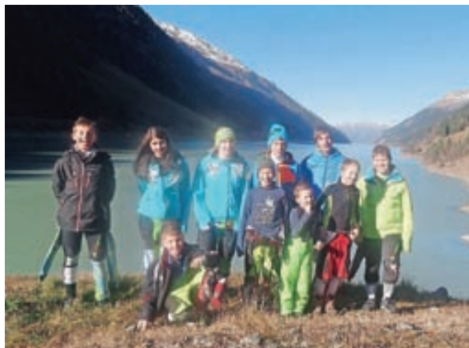
To smo mi – Smučarski klub Domel.