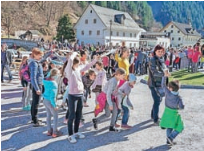
Po približno 45 minutah so plesalci prispeli na trg pred cerkvijo sv. Antona, kjer je sledilo še druženje.