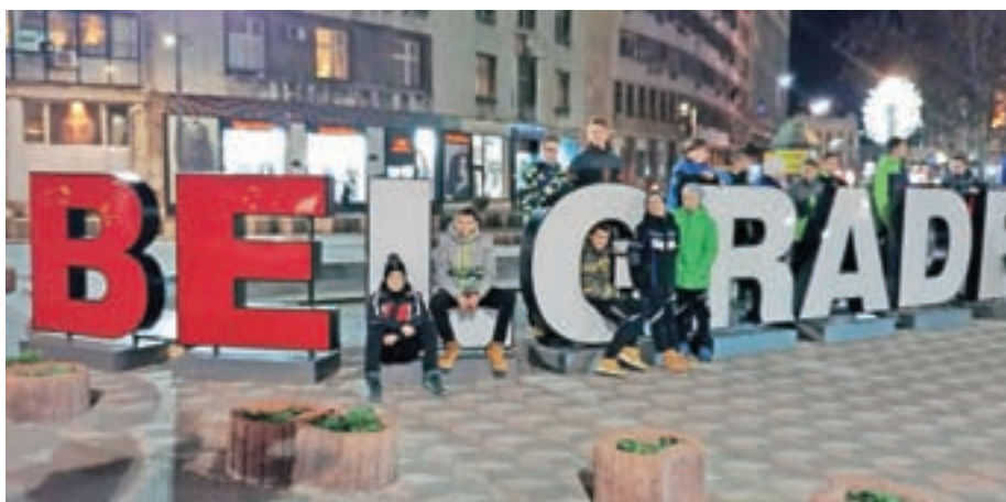
Igralci mlajših dečkov A in starejših dečkov na mednarodnem turnirju v Beogradu

Ne smemo pa pozabiti najmlajših selekcij. Mini rokometiši in mlajši dečki C so se januarja udeležili enodnevnega turnirja v Grosupljem, aprilu pa še Zajčkovskega turnirja v Radečah. Sploh v Radečah je bilo otrokom zelo všeč, saj so poleg zmag domov odnesli še polno