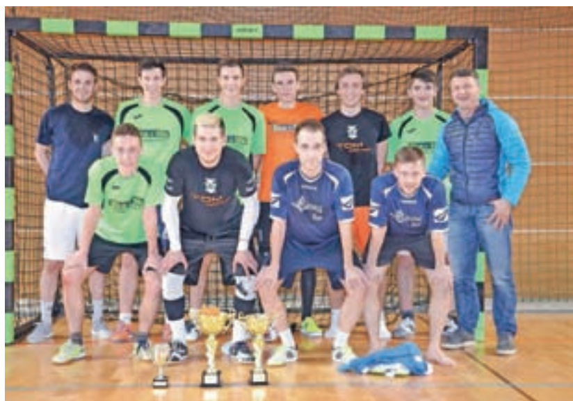
Zmagovalni ekipi nogometne lige: Ekosilk in Sirena bar

v muzejski galeriji razstava o tej za kletljanje in njegov razvoj zelo pomembni izobraževalni ustanovi nekoč in danes.