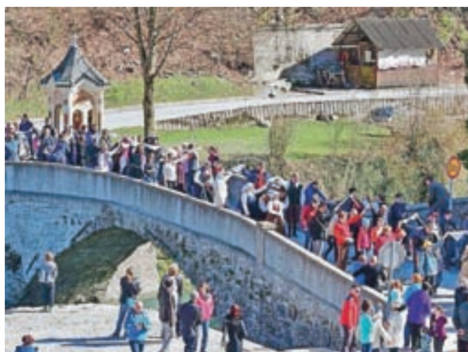
Odziv plesalcev je bil velik, v sprevodu je sodelovalo kar 118 parov.