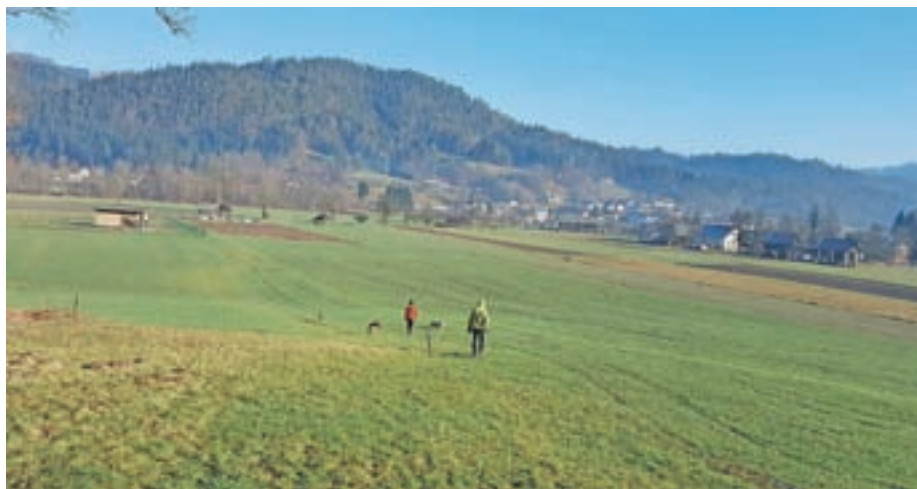
Pogled na Meglišek, hrib, ki se razprostira nad Dolenjo vasjo

Osmislimo svoje življenje in življenja mladih generacij.