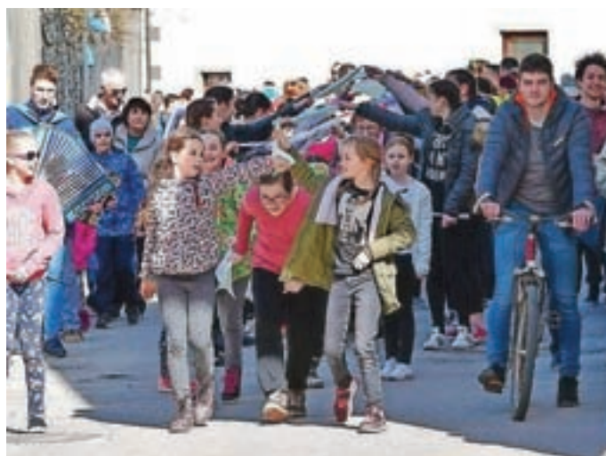
Pri "šivanju kovtrov" so sodelovali tudi številni otroci.