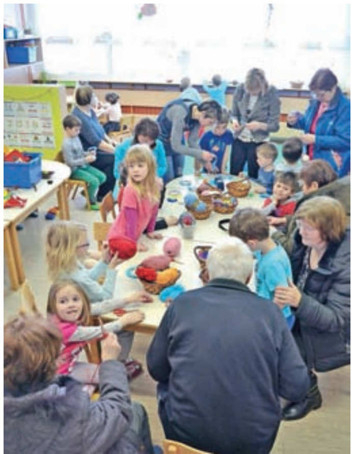
Z dneva odprtih vrat v vrtcu v Selcih

Vrtec Železniki sestavlja štirinajst oddelkov z okoli 260 otroki. Enajst oddelkov je v Železnikih (dva v prostorih šole), trije pa v Selcih. "Vsakodnevno se trudimo, da se otroci ob tem, da se imajo pri nas lepo, tudi veliko novega naučijo. Naš cilj so si-