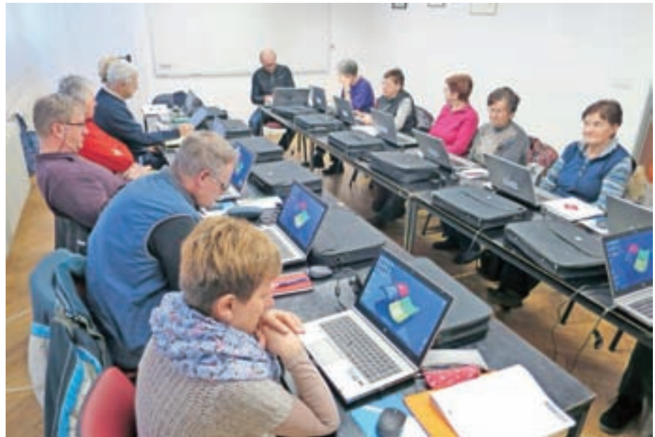
Tečaj Stopimo v svet računalnikov v Lokalnem učnem središču Železniki

Od novembra do konca aprila je sejna soba KS Železniki v popoldanskih urah zasedena po dva-, tri- in včasih celo štirikrat na teden, skratka prostor se je spremenil v lokalno učno središče. Med vsebinami, ki so bile najbolj zanimive za občane, so bili jezikovni tečajji (potekali so začetni in nadaljevalni tečaj angleščine, nadaljevalni tečaj nemščine, potekata pa še začetni tečaj nemščine in francoščine), tečajji in delavnice s področja računalništva (uporaba Facebooka in začetni tečaj računalništva) in tečaj ročnih del – kvačkanje. Zelo veliko interesa je bilo tudi za delavnico Nega in oskrba, ki so jo v treh delih izvedle strokovne delavke Centra slepih, slabovidnih in starejših.