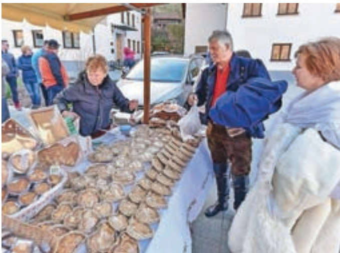
Med ponudbo na stojnicah so bili tudi dražgoški kruhki.