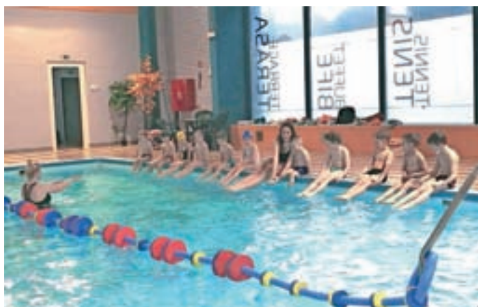
Otroci na plavalnem tečaju

V letošnji pomladi v muzeju načrtujemo odprtje dveh novih muzejskih kotičkov: arheološke vitrine in kotička o izdelovanju dražgoškega kruhka. Odprtje slednjega bo na mednarodni muzejski dan, to je 18. maja, ko v muzeju pripravljamo dan odprtih vrat in dogodke, povezane s peko dražgoškega kruhka. V letošnjem šolskem letu obeležujemo 110. obletnico ustanovitve čipkarske šole v Železnikih. Ob tej priložnosti bo