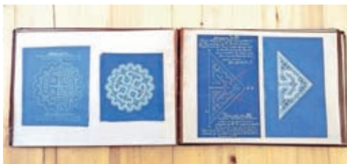
Vezena knjiga s klekljanimi vzorci

Velika knjiga s papirnatimi vzorci Učni red za učenje klekljanja v Čipkarski šoli od 1907 do 1918 je v knjigo vezana zbirka oštevilčenih vzorcev – muštrov za klekljanje. Vsebuje 53 oštevilčenih in nekaj dodatnih vzorcev. Na vzorcu so napisana