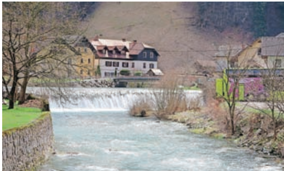
Dermotov jez bodo porušili in 300 metrov višje zgradili novega. Nov bo tudi most v Ovčjo vas.