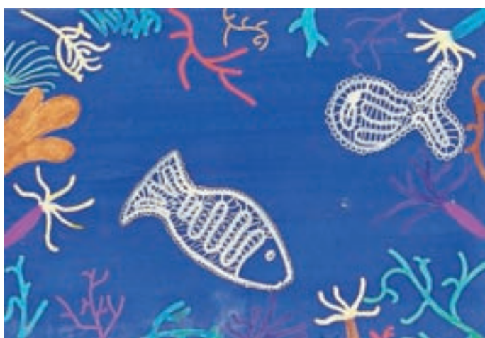
Tinkara Rakovec, 5. b, PŠ Selca