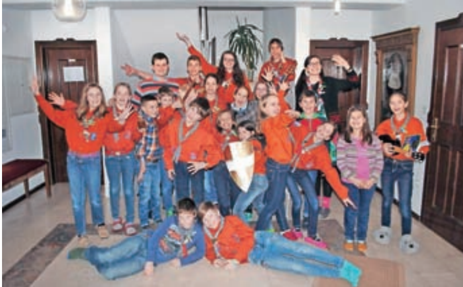
Pripravljene smo na boj z ledeno kraljico

Vsako leto 22. februarja skavti po vsem svetu praznujemo rojstni dan našega ustanovitelja Roberta Baden-Powella (B. P.). Na ta dan skavti še posebno skrbno delamo dobra dela. V soboto, ki je sledila dnevu spomina, smo se vsi skavti iz stega Železniki 1 zbrali skupaj in v spomin na našega ustanovitelja imeli veliko igro. V njej so morali skavti pokazati svoje spretnosti v skavtskih veščinah in znanje o življenju Roberta Baden-Powella. Ključno za hitro napredovanje po igralni plošči pa je bilo tudi sodelovanje v skupini, kar B. P. poudarja tudi v svoji skavtski metodi. Da je bila igra še bolj napeta, pa je poskrbela unikatna igralna plošča, ki je s posebnimi polji skupino lahko popeljala v vodstvo ali pa skoraj na začetek. Ko so vse skupine prišle na cilj, je sledil še drug del igre, ko so si skupine med seboj kradle zasta-