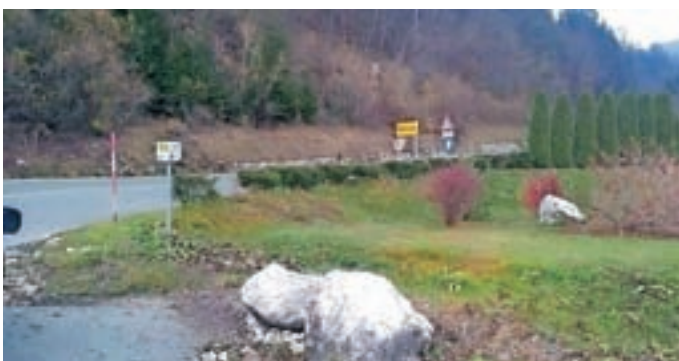
Tako mora biti porezana živa meja, da je križišče pregledno.