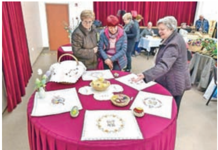
Obiskovalci so si z zanimanjem ogledali tudi velikonočne prtičke članic Društva upokoencev Selške doline.