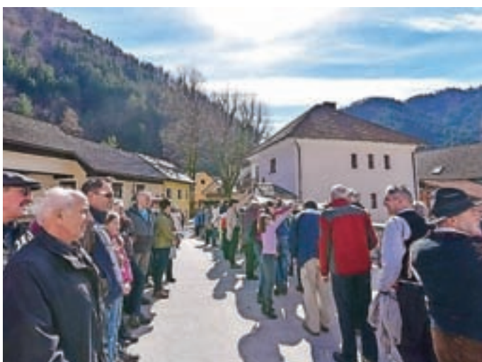
"Šivanje kovtrov" je pritegnilo tudi številne gledalce.