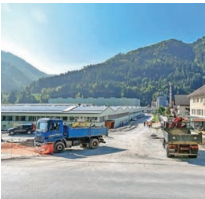
Preglednost uvoza v poslovno cono se bo po rekonstrukciji precej izboljšala.

Župan je optimističen, da bodo kljub vsemu z bližnjimi stanovalci Na Kresu našli skupni jezik glede izgradnje doma starejših, ki si ga v Selški dolini že dolgo želijo.