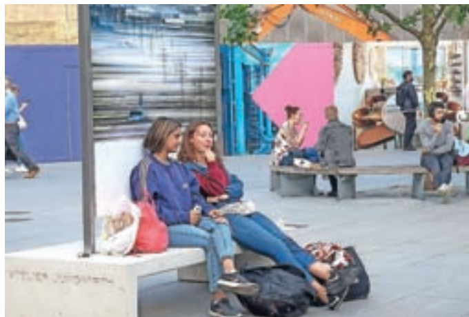
Londonski utrip pred Andrejevim Sorškim poljem

„Povabila k sodelovanju sem še posebej vesel, ker ni šlo za natečaj, kamor fotografi sami pošiljamo fotografije, ampak so organizatorji razstave – ob sicer množici odličnih slovenskih fotografov – poiskali in izbrali mene. Res je dober občutek, da si opažen na mednarodni fotografski sceni, kar je zame tudi nova izkušnja,“ je ob razstavi povedal samostojni fotograf An-