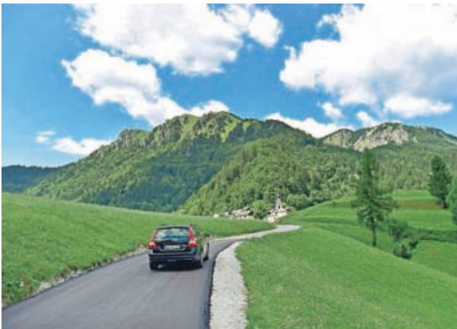
Obnovljena cesta proti Prtovču

Občina Železniki si je letos v programu investicij v občinske ceste zadala tudi rekonstrukcijo dveh daljših odsekov. Rekonstrukcijo ceste Podlonk–Prtovč, ki je stala 190 tisoč evrov, so že končali sredi poletja. Cesto so uredili na dveh delih. Prvi je v začetnem odseku na križišču za Podlonk, drugi pa pod vasjo Prtovč. Oba skupaj sta dolga dobrih tisoč metrov. Investicijo je izvajalo podjetje Mapri Proasfalt in njegov podizvajalec Todograd, ki sta se nato lotila še rekonstrukcije lokalne ceste Tajnetova žaga–Potok v dolžini 800 metrov. Tudi ta investicija se bliža koncu, saj je v prihodnjem tednu že predvideno asfaltiranje. Obnovili so tudi objekte za odvodnjavanje.