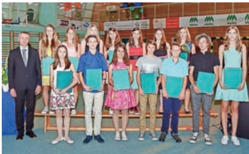
Štirinajst devetošolcev, ki so vsa leta imeli izjemen uspeh.