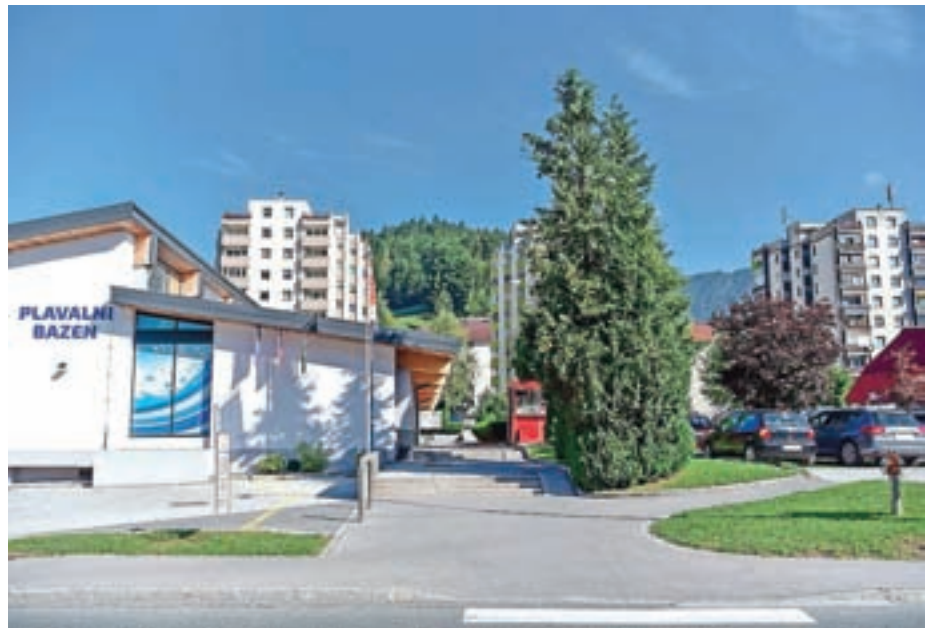
Za razbremenitev dostopa občina že načrtuje dodatno cesto med plavalnim bazenom in Mercatorjem.

Stanovalci so se sicer pred leti na tem mestu nadejali dodatnih parkirišč, a je območje veljajo za poplavno ogroženo, zato se čudijo, kako je nenadoma ob vodotoku možno graditi dom sta-