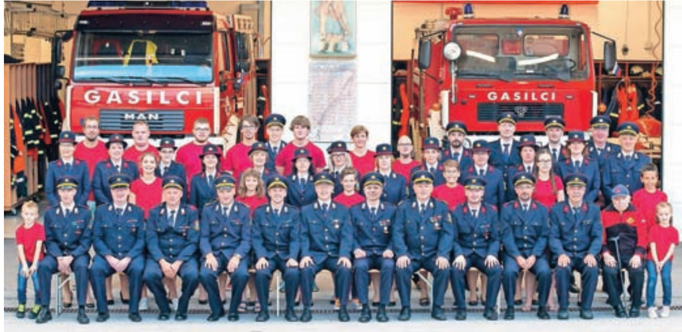
Gasilska fotografija ob 120-letnici ustanovitve PGD Železniki