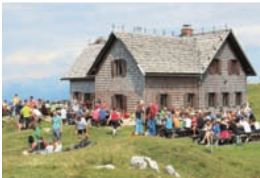
Udeleženci prireditve Ratitovec raja pred Krekovo kočico