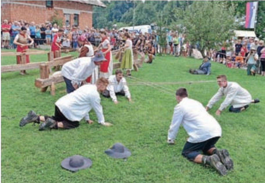
Davški fantje so se po dolgih letih spet pomerili v igri vlečenje uši, tako kot na prvih Dnevih teric.

dosežke pri razvoju turizma, TD pa se mu je zahvalilo s posebno sliko sejalca, ki je delo slikarja Mira Kačarja iz Sorice. Nedeljski program je k Vrhovcu po oceanah organizatorjev privabil vsaj 2500 do tri tisoč obiskovalcev, ki so po kulturnem programu, posvečenemu 50-letnici TD Davča, z zanimanjem spremljali tudi etnografski program. Kot običajno so prikazali večino opravil, povezanih s predelavo lanu: puljenje lanu na njivi, sušenje v laneni jami, trenje lanu, mikanje in tresenje prediva, predenje na kolovratu, tkanje na statvah ... Ob prikazih so obiskovalci izvedeli tudi veliko zanimivega, med drugim, da je terica na dan strla približno od deset do dvanajst kilogramov lanu in da je bilo to delo zelo naporno. Mladi Davčarji so tokrat po dolgih letih prikazali igro vlečenje uši, ki so jo izvajali na prvih Dnevih teric. Fantje so nekoč z vlečenjem vrvi, napete okoli glave, tericam hoteli poka-