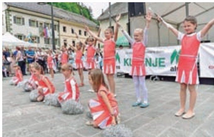
Letošnja novost so bili tudi nastopi plesnih in folklornih skupin pred plavžem.