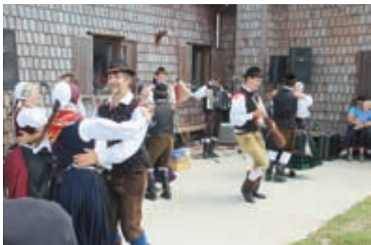
Folklorna skupina Bohinj med nastopom na prireditvi Ratitovec raja

S pričetkom septembra smo zakoračili v zadnjo četrtino poletne sezone in to je že čas, ko lahko pregledamo, kako smo v društvu izpolnjevali načrtovane aktivnosti. Ena od pomembnih aktivnosti je priprava rekreativnih prireditev, s katerimi omogočimo številnim planincem in ostalim ljubiteljem raznovrstno gibanje, na območju Ratitovca.