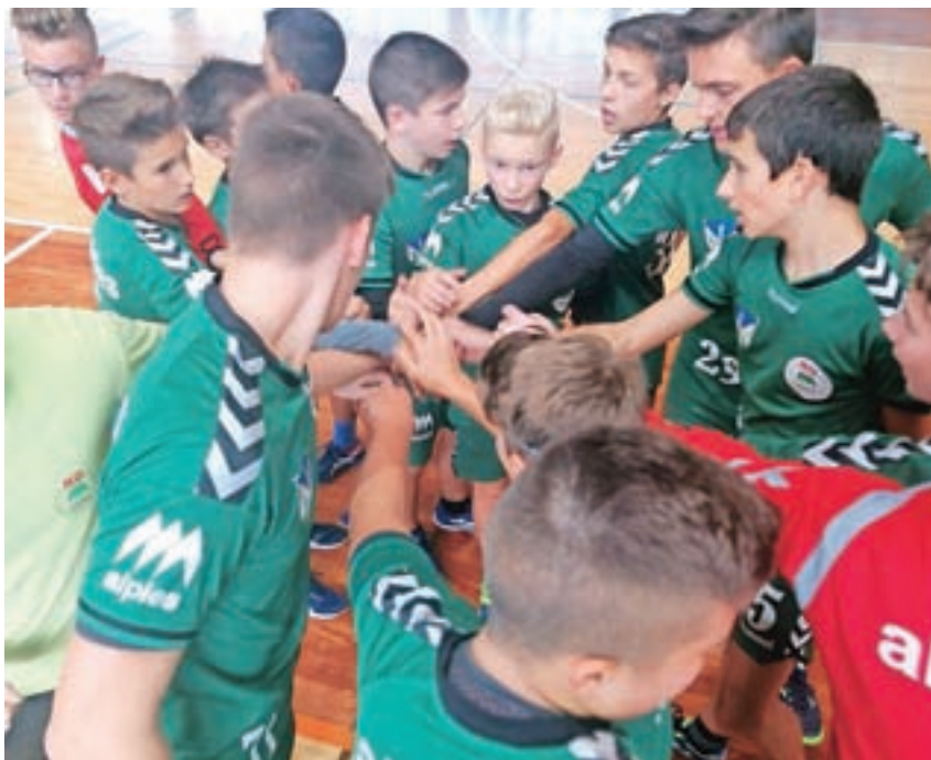
Starejši dečki na turnirju v okviru iger JZR

Kljub športni dvorani pa vsako leto treninge začenjamo v naravi, na športnem igrišču in okoliških poteh. Tako so članska ekipa ter ekipi mlajših in starejših dečkov že v avgustu začeli z nabiranjem kondicije, sedaj, ko je sezona pred vrati, pa so začeli s treningi v dvorani. Za nami je že prvi turnir za mlajše selekcije in člansko ekipo v okviru iger JZR, člansko ekipo pa jutri čaka že nova preizkušnja, turnir v Cerkljah. Turnir v okviru iger JZR je bil super preizkušnja za vse selekcije, saj so tako vsaj malo "razbili" monotonost treningov. Odigranih je bilo kar 12 tekem, mlajši dečki A in B ter starejši dečki A so se pomerili proti vrstnikom iz Cerkelj in Škofje Loke, prav tako pa je članska ekipa odigrala tekmi proti gostom iz Cerkelj in škofovskim mladincem. Vse tekme so bile napete, glede na to, da je šlo za prijateljske tekme, pa rezultat seveda ni bil v ospredju.