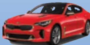
...danes v letu 2018 - napredek kakovosti in prepoznavnosti je očiten