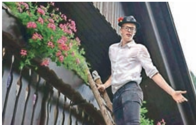
Prikazali so tudi star ljudski običaj "pobiranje kranceljnov".