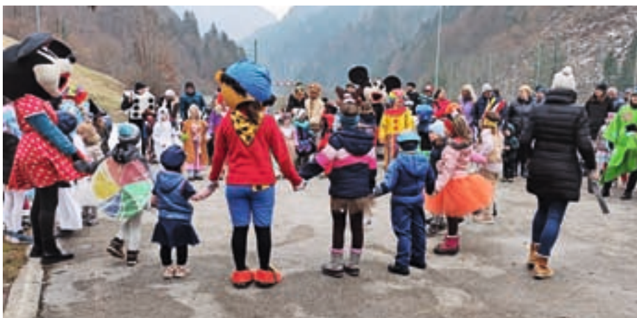
Pustno rajanje na Zalem Logu

V nedeljo je bilo na isti lokaciji še pustno rajanje, ki so ga pripravili štirje klovnovi iz Dražgoš. »Zbrali smo se pri nekdanji trgovini v vasi pri šoli, kjer smo posneli skupno pustno fotografijo,