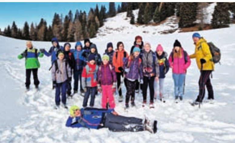
Zimske radosti na planini Korošica

Januarja vedno načrtujemo sankanje, tokrat pa smo se v čakalju na sneg podali na pohod na planino Korošica. Pod mejnim prehodom Ljubelj smo se podali po neoznačeni poti na planino. Že po dvesto višinskih metrih nas je prijetno presenetil sneg, ki ga je bilo na naše veselje za vsakim ovinkom več. Mladi planinci so na planini uživali v čudovitih razgledih in snežnih radostih. Domov smo se vračali prešerne volje, ker je bil to »najboljši planinski izlet do sedaj«.