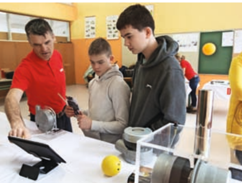
Obiskovalcem se je predstavil tudi Domel.

Obiskovalci so si z zanimanjem ogledali tudi predstavitev podjetij Domel, Niko, Alples, Lotrič Meroslovje in LTH Castings Škofja Loka. Spoznali so lahko njihove programe in konkretne, tudi zelo inovativne izdelke. Katero področje jih najbolj zanima, so učenci lahko ugotavljali še na delavnicah. Prav tako so obiskovalci izvedeli, kakšne so možnosti štipendiranja in opravljanja vajeništva v podjetjih ter kakšne so trenutne in prihodnje kadrovske potrebe.