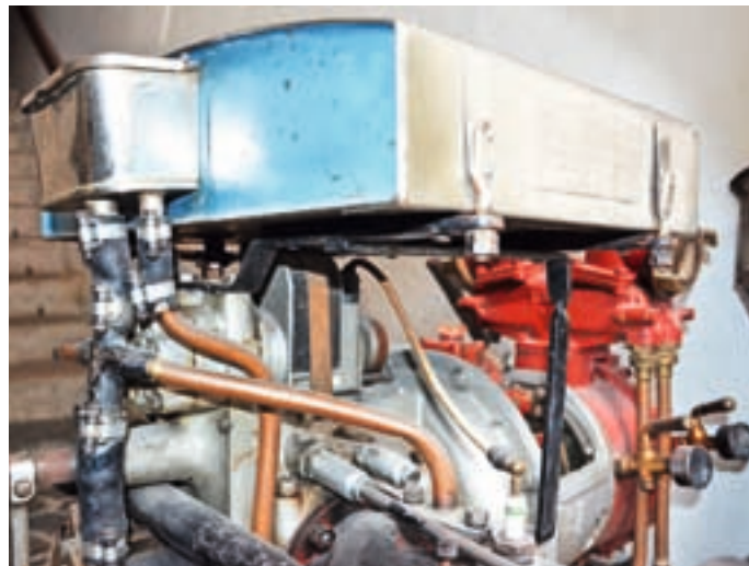
Motorna brizgalna Rosenbauer iz leta 1938

Prostovoljno gasilsko društvo Železniki je imelo ustanovni občni zbor pred 125 leti, 15. februarja 1898. Ob 40-letnici delovanja so leta 1938 na Racovniku zgradili nov gasilski dom in kupili motorno brizgalno. Ker je bila gasilska blagajna prazna, so za nakup brizgalne zbirali prispevke. Ob tej priložnosti sta predsednik Polde Košmelj in tajnik Franc Srebrnjak pripravila spominsko knjižico. Na prvi strani sta zapisala: »Na pomoč! Prostovoljna gas. četa Železniki vljudno