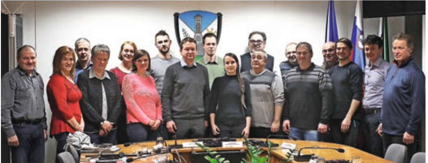
Občinski svet Občine Železniki v mandatu 2022–2026 sestavlja pet občinskih svetnic in dvanajst svetnikov.

Občinski svetniki so na januarski seji imenovali člane občinskih odborov in komisij, potrdili višje cene programov v vrtcih in z odlokom razglasili pokopališko kapelo sv. Križa v Selcih za kulturni spomenik lokalnega pomena.